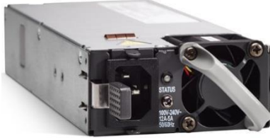
Figure 13. Alimentation CA 650 W