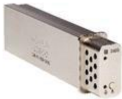
Figure 11. Stockage SSD 240G

Les Figures 11 et 12 montrent certains des accessoires disponibles.