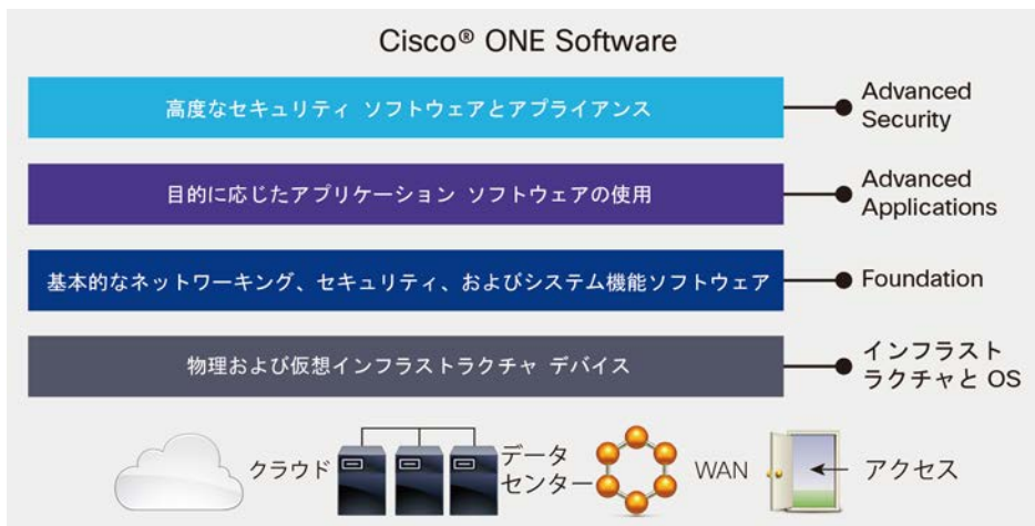
図 1. Cisco ONE Software に含まれる 3 つの製品タイプ：Foundation、Advanced Applications、Advanced Security

Cisco ONE Software には、次の 4 つの重要なメリットがあります。