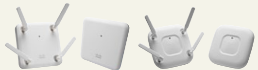
Cisco Aironet シリーズ

©2015 Cisco Systems, Inc. All rights reserved.