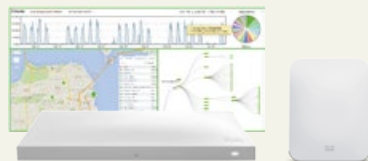
Cisco Meraki MR シリーズ