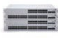
Meraki MS 以太网交换机