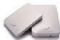
Meraki MR 无线局域网