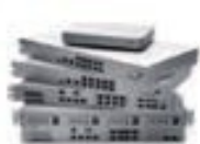
Meraki MX 安全网关